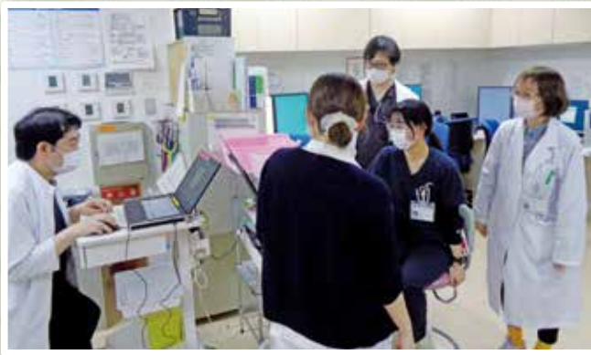
多職種カンファレンス

これからも、患者様やご家族に信頼していただける看護を大切にしながら、あたたかい病棟づくりを心がけていきます。よろしくお願いいたします。