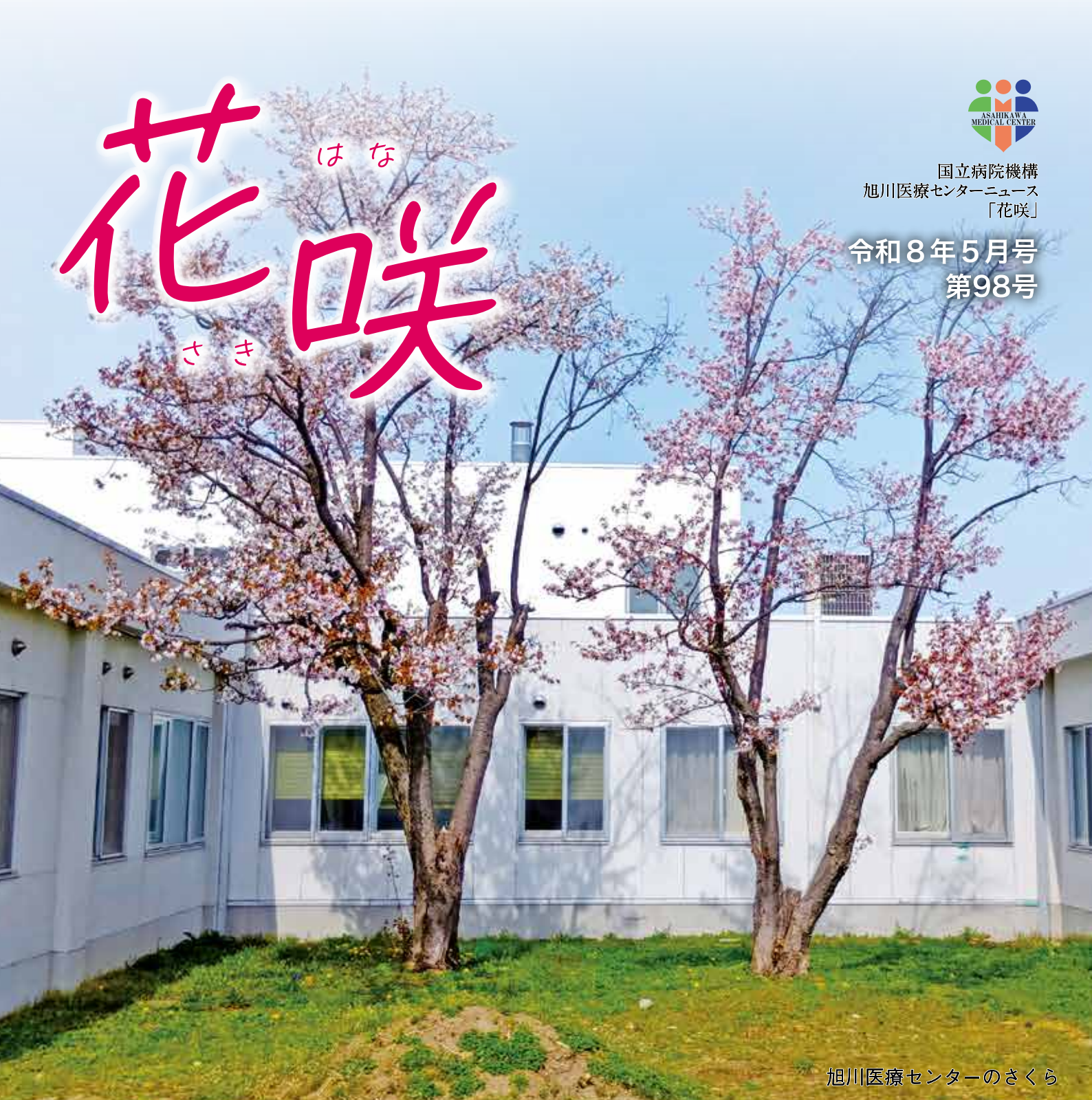
旭川医療センターのさくら