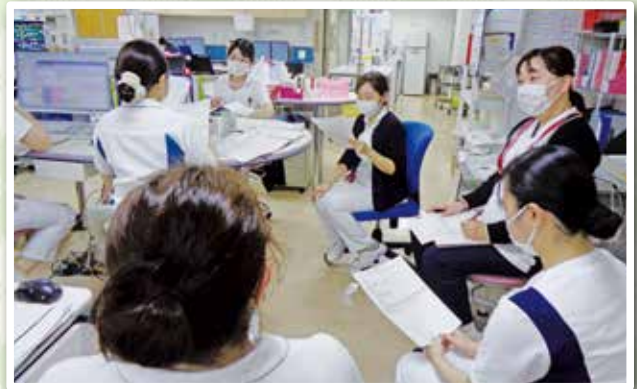
病棟カンファレンス