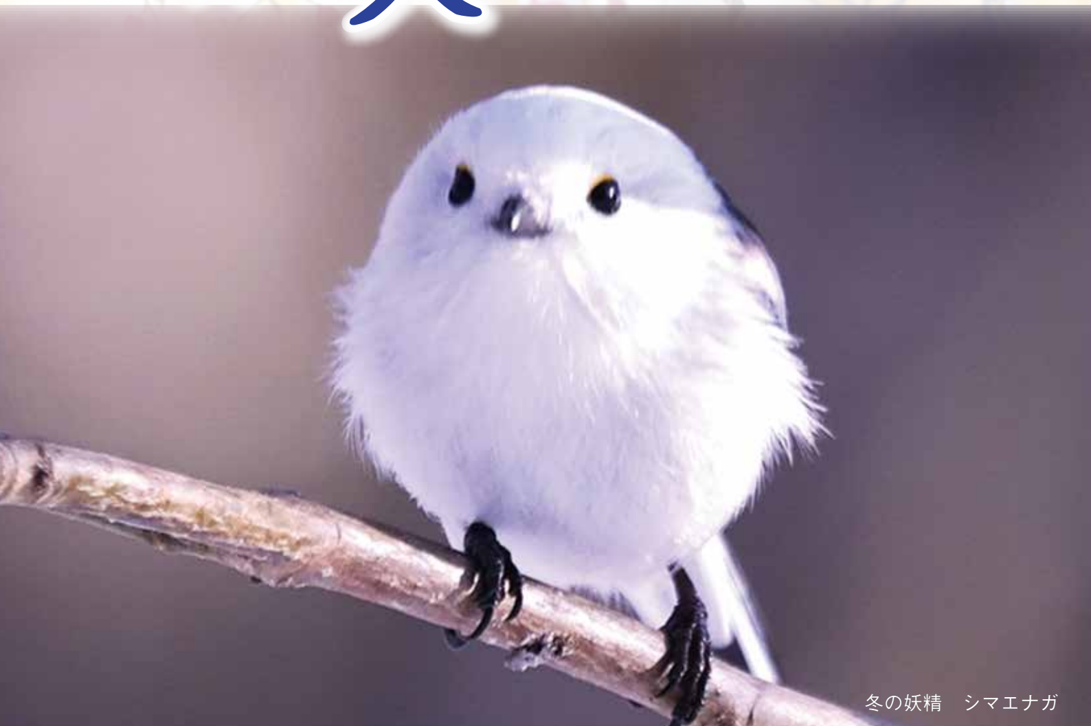
冬の妖精 シマエナガ