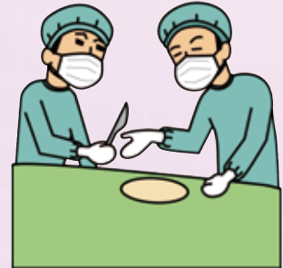
図4 手術中にも病理検査は行われています