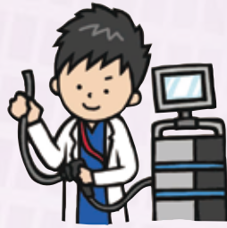
図2 気管支鏡検査を行います