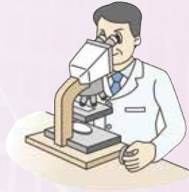
図3 病理医が顕微鏡を見て「肺癌」と診断しました