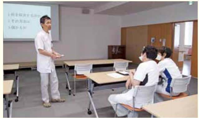
参加者とのやりとり