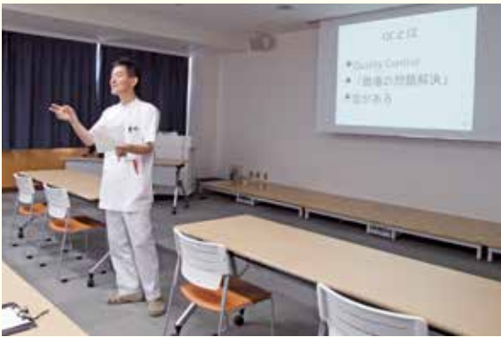
講演の様子。撮影のためマスクを外して撮影しています。

QC活動は10年程度続けてきたのですが、新型コロナのため2年間中止としていました。今年度から例年通り年末に開催を予定しています。