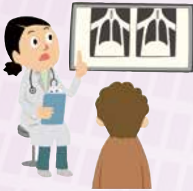
図1 レントゲン検査を行ったところ、「入院して内視鏡検査をしましょう」と言われました