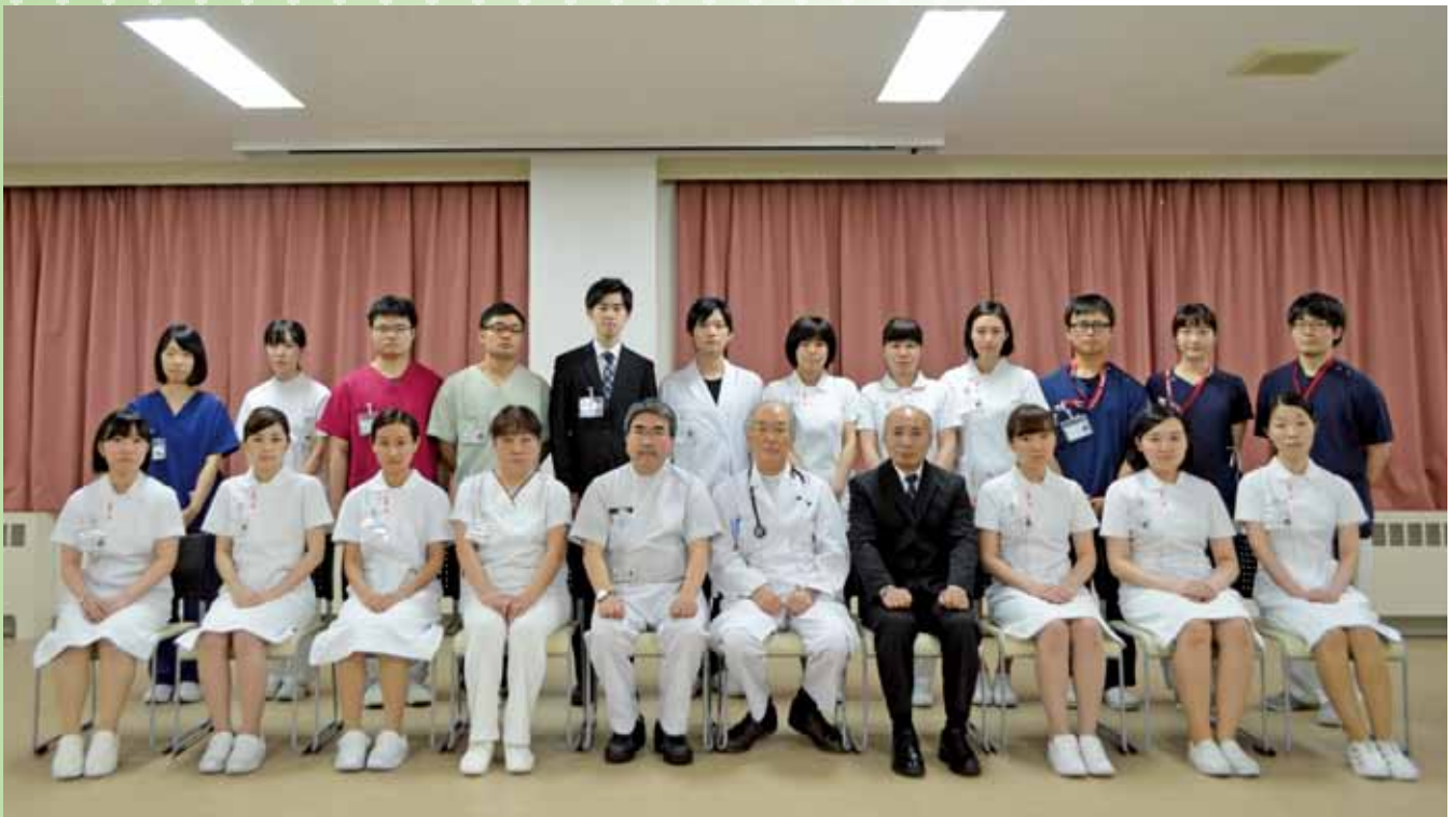
平成29年度新規採用者

わたくしたちは、安全で質の高い医療を提供し、 患者さんの目線に立ち、信頼される病院をめざします。 国立病院機構の病院として、 みなさんの健康と幸福をいつも願っています。