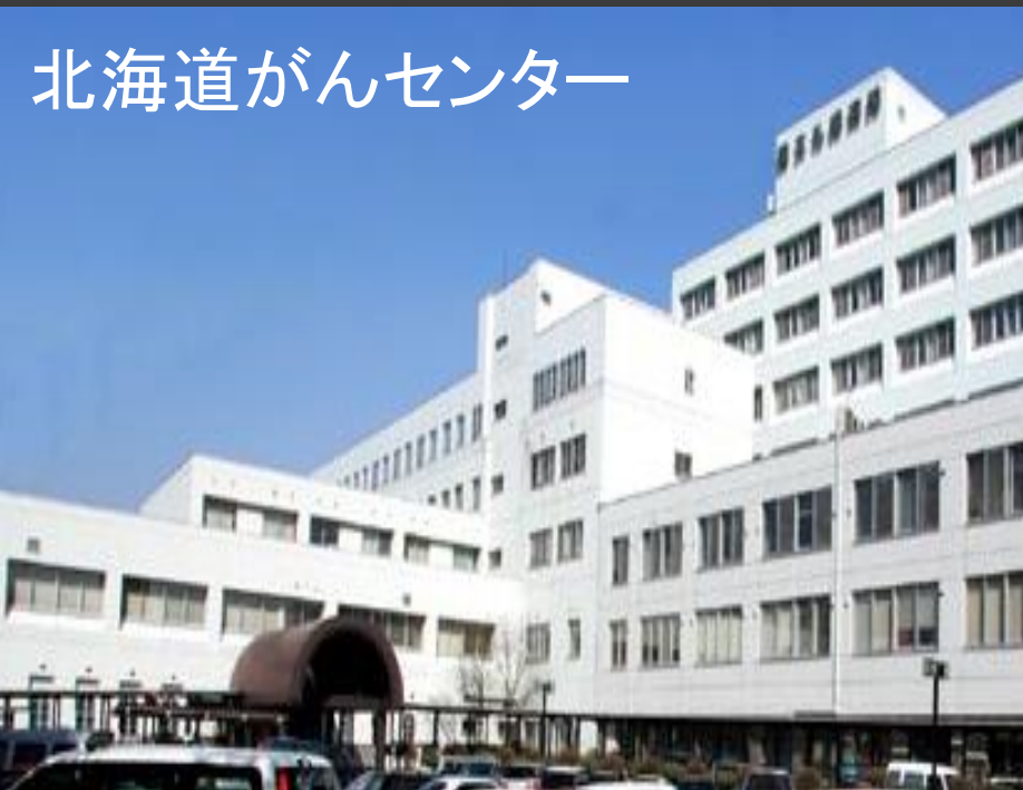
北海道がんセンター