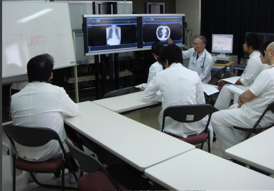
モーニングレクチャー