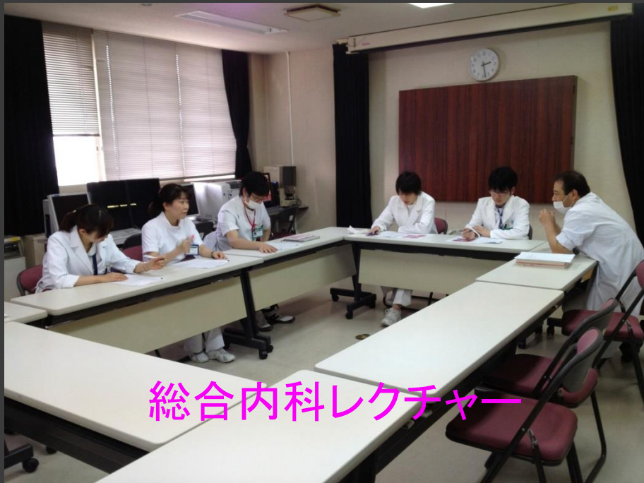
総合内科レクチャー