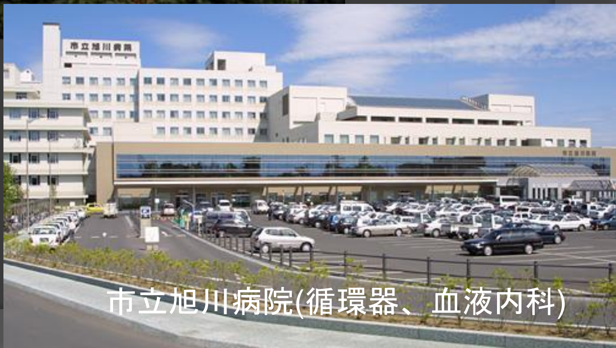
市立旭川病院(循環器、血液内科)